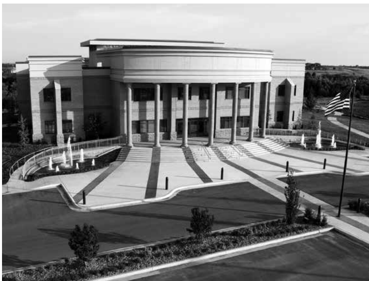
Philadelphia Church of God hoofdkantoor in Edmond, Oklahoma

UIT DE SARDIS-KERK ONTSLAGEN VOOR HET VOLGEN VAN GOD EN DE WAARHEID DIE HIJ OPENBAARDE. En meer dienaren zullen “ontslagen” worden uit de WCG als zij deze boodschap van Maleachi beginnen te onderwijzen. HET IS GEEN ZONDE DE LAODICEA-KERK TE VERLATEN EN ZICH TE VOEGEN BIJ DE FILADELFIA-KERK VAN GOD. Het is een zonde indien we NALATEN dit te doen! U VERLAAT HET LICHAAM VAN CHRISTUS NIET!