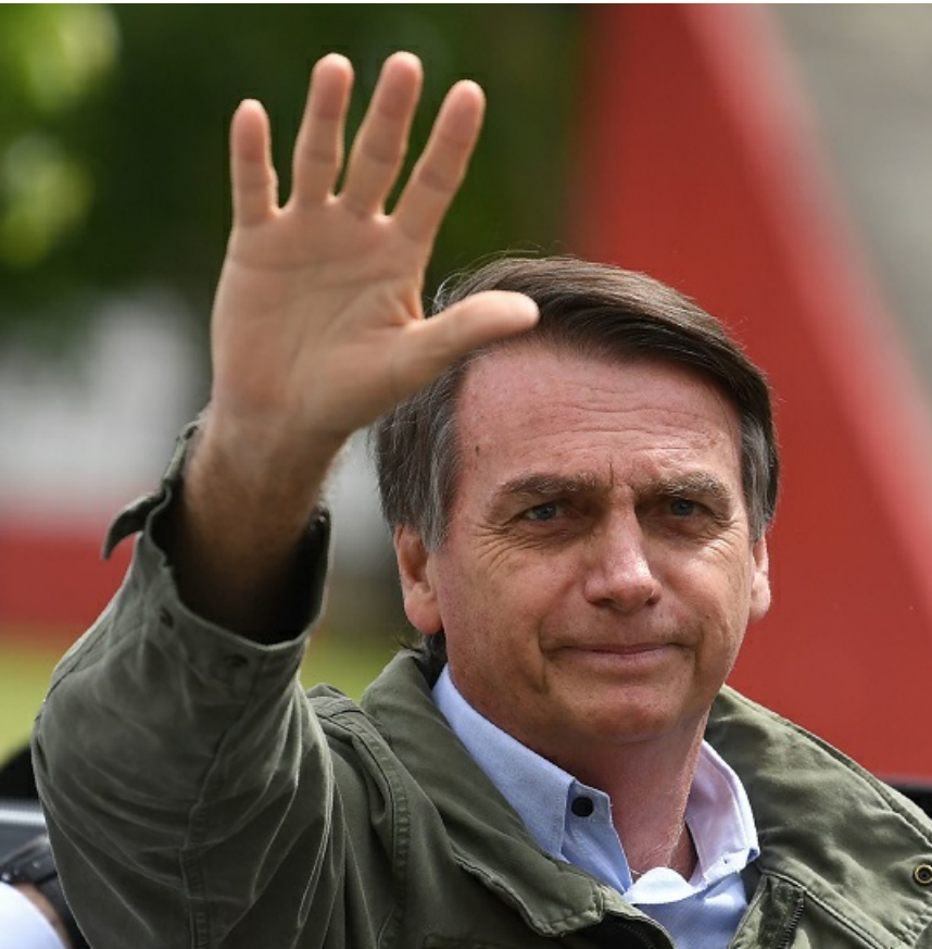
De nieuwe president van Brazilië, Jair Bolsonaro

“Met meer dan 260 miljoen mensen en een bruto binnenlands product van ongeveer $2.9 biljoen, is mercosur een van 's werelds grootste economische blokken,” vervolgden we, “Europa moet dringend een deal sluiten met Zuid-Amerika om zijn handelsbeleid te laten werken.”