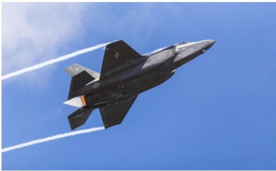
U.S. Air Force F-35A Lightning II